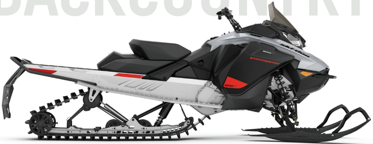
BACKCOUNTRY™ SPORT VIST