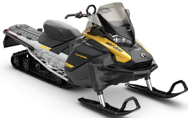
TUNDRA™ LT 600 EFI KUVASSA