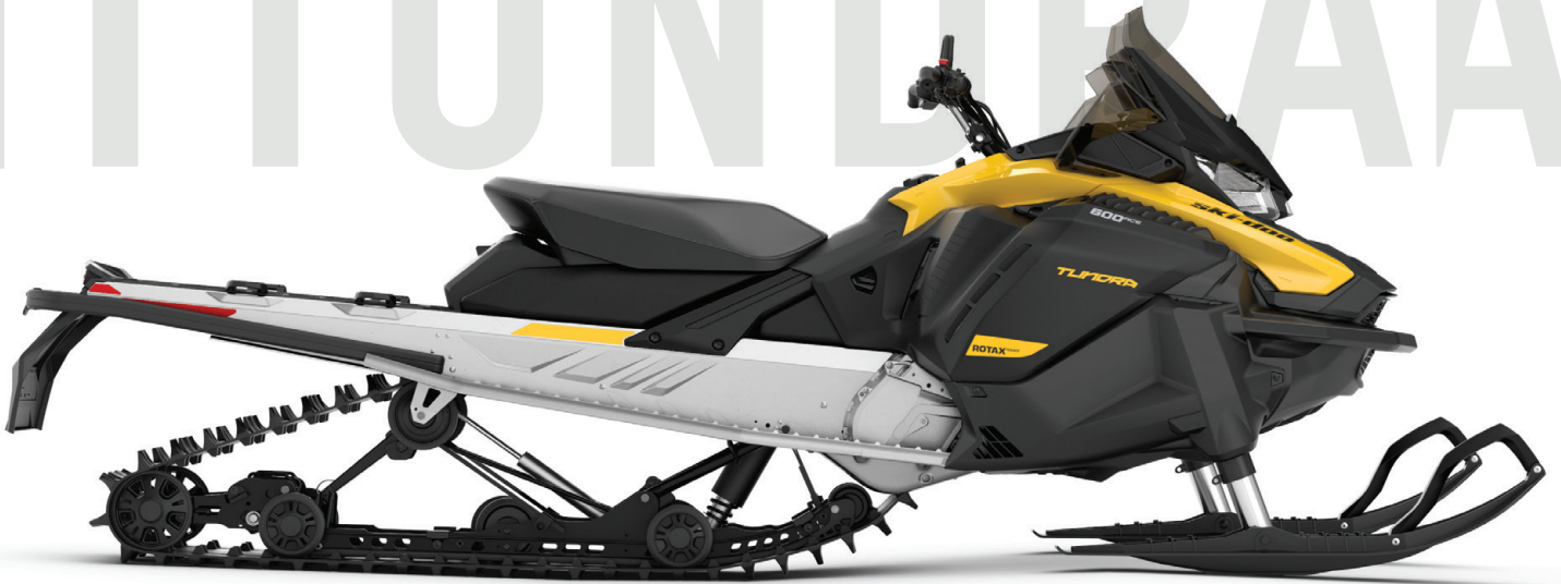
TUNDRA™ LT 600 ACE™ KUVASSA