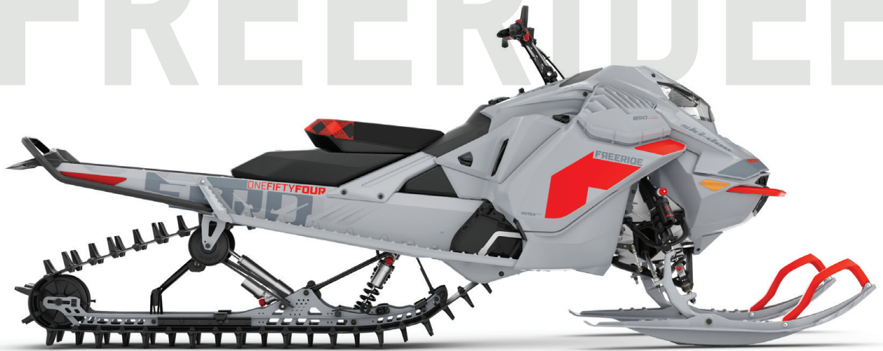
FREERIDE™ 154 850 E-TEC® TURBO KUVASSA