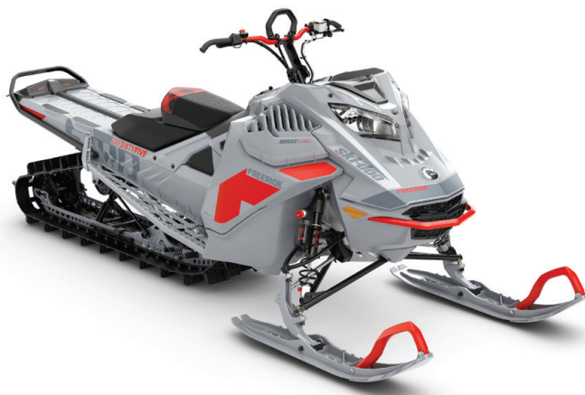
FREERIDE™ 165 850 E-TEC® TURBO KUVASSA