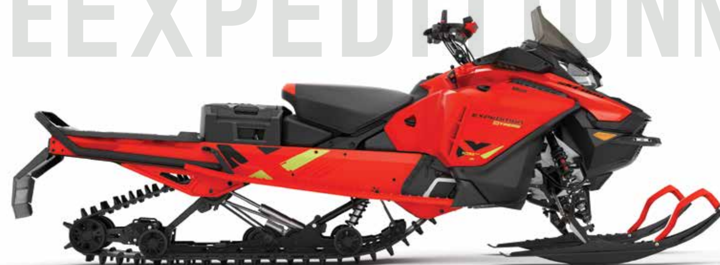
EXPEDITION ® XTREME 850 E-TEC MONTRÉ