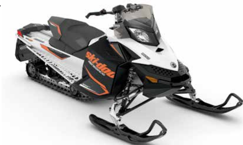
RENEGADE ® SPORT 600 Carb montré