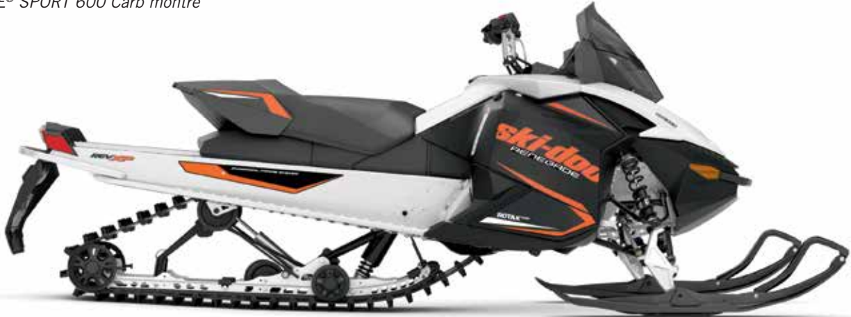
RENEGADE® SPORT 600 Carb montré