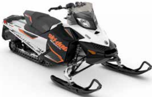
RENEGADE® SPORT 600 Carb montré