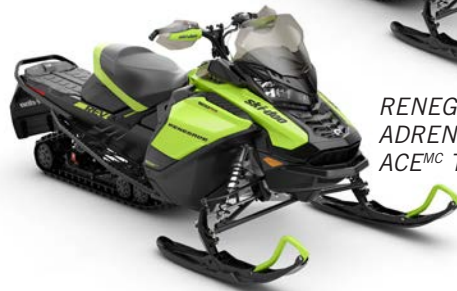
RENEGADE® ADRENALINE 900 ACE MC TURBO montré