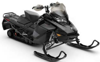
RENEGADE® ADRENALINE 600R E-TEC® montré