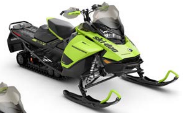
RENEGADE® ADRENALINE 850 E-TEC® montré