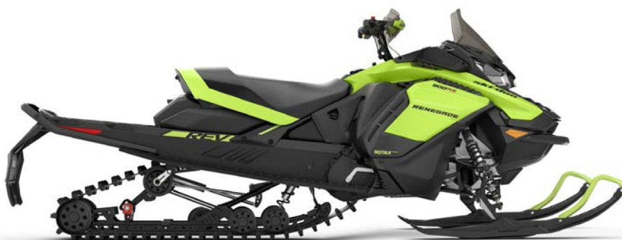
RENEGADE® ADRENALINE 900 ACE MC TURBO montré