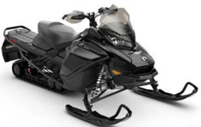
RENEGADE® ADRENALINE 900 ACE MC montré