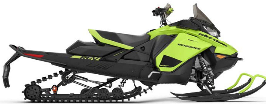
RENEGADE® ADRENALINE 850 E-TEC® montré