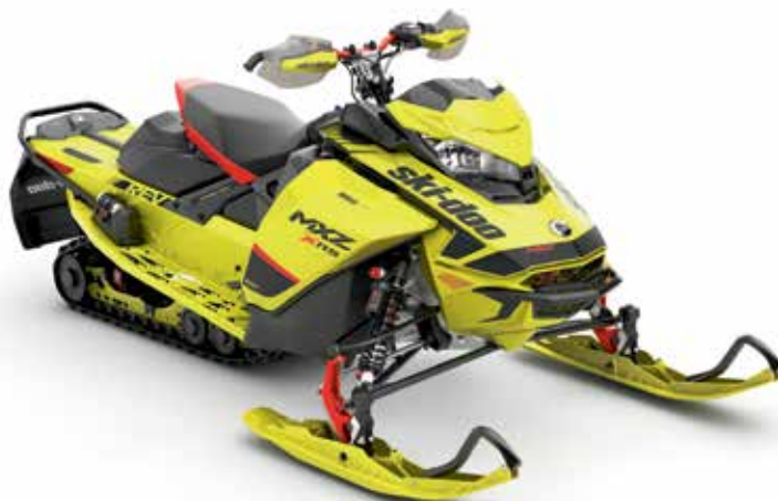
MXZ ® X-RS ® 850 E-TEC ® montré