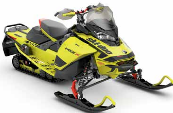
MXZ® X® 850 E-TEC® montré