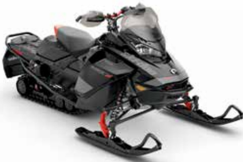
MXZ® X® 600R E-TEC® montré