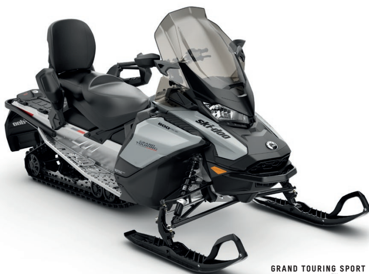
GRAND TOURING SPORT 600 ACE™ VISAS

ledkomfort för två med fina köregenskaper och elegant utförande.