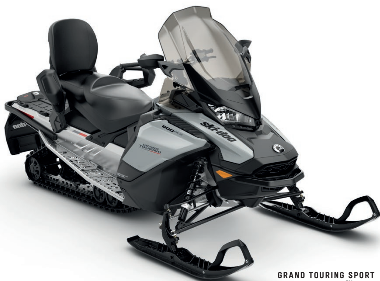
GRAND TOURING SPORT 600 ACE™ VIST

For førere som ønsker stilig komfort hele veien, enkel manøvrering, velkjent pålitelighet og god valuta for pengene, er det ingen grunn til å lete videre. Svaret er 2022 Ski-Doo Grand Touring Sport - bygget på den smidige REV Gen4-plattformen med Rotax ACE-motorer.