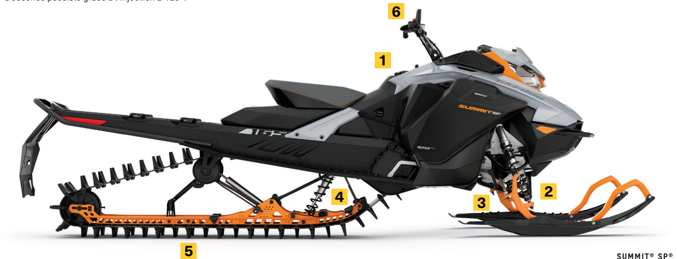
SUMMIT® SP® 165 850 E-TEC® MONTRÉ

Alliage léger et nouvelle butée de ski pour réduire la résistance du ski. Comportement plus prévisible lors de passages techniques à flanc de montagne et en terrain difficile.