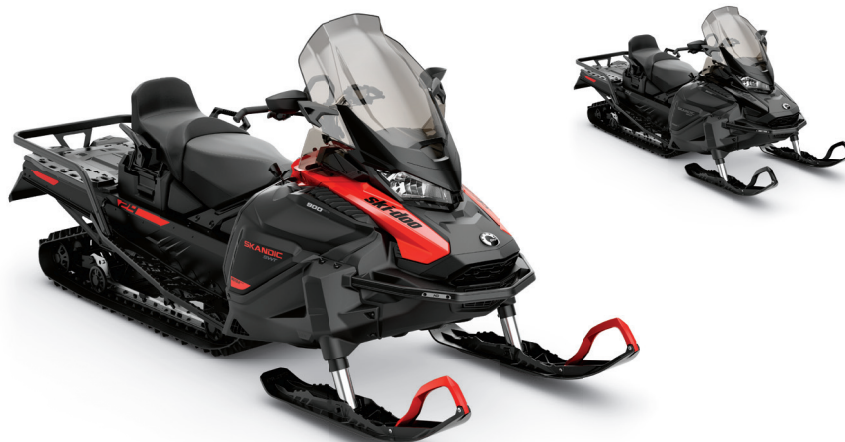
SKANDIC® SWT 900 ACE MC MONTRE

Traction et flottaison hors-piste optimales avec la chenille la plus large de l'industrie.