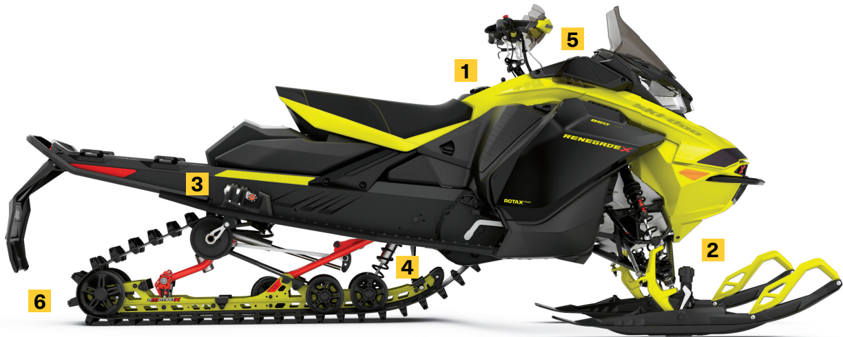
RENEGADE® X-RS® 850 E-TEC® MONTRÉ

Transforme complètement les caractéristiques de maniabilité de la motoneige selon le style de conduite et les conditions avec une simplicité inégalée. Comprend le système d'ajustement rapide pour rMotion X et les skis Pilot TX.