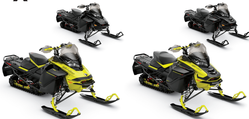
RENEGADE® X® 850 E-TEC® MONTRÉ

Des caractéristiques de haute performance et de haute technologie pour les motoneigistes les plus exigeants.