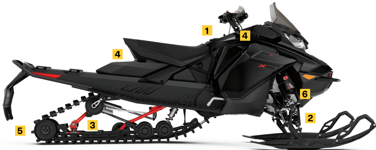
RENEGADE® X-RS® AVEC ENSEMBLE COMPÉTITION MONTRÉ

Prêt pour la compétition avec suspension arrière et rails renforcés, tendeur de chenille ultra-robuste, barres de liaison d'accélération et extension de bras.