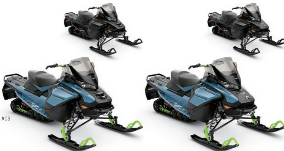
RENEGADE® ENDURO MC 900 ACE MC TURBO R MONTRÉ