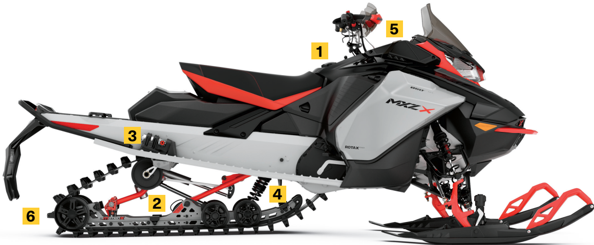
MXZ® X® 850 E-TEC® MONTRÉ

Transforme complètement les caractéristiques de maniabilité de la motoneige selon le style de conduite et les conditions avec une simplicité inégalée. Comprend le système d'ajustement rapide pour rMotion X et les skis Pilot TX.