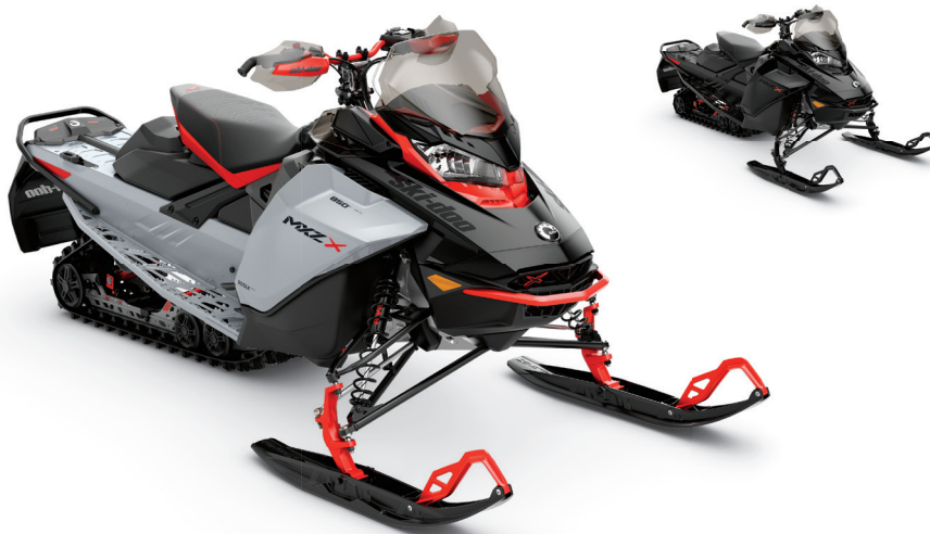
MXZ® X-RS® 850 E-TEC® MONTRÉ

Caractéristiques de haute technologie et ADN de course pour les coureurs de sentiers endurcis.