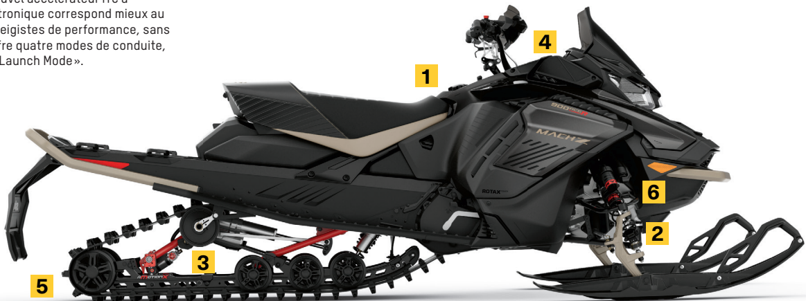
MACH Z MC 900 ACE MC TURBO R MONTRÉ

Hauteur abaissée de 1,5 po pour améliorer l'aérodynamisme, baisser le centre de gravité, augmenter la traction avec un meilleur angle d'attaque de la chenille et une allure agressive.