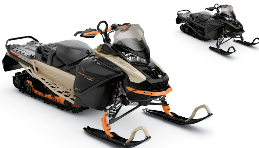
EXPEDITION® XTREME MC 850 E-TEC® MONTRÉ

Une motoneige sport-utilitaire de haute performance, capable de se rendre partout.