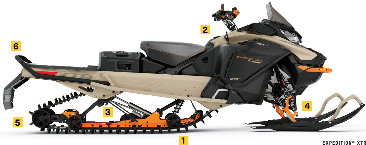
EXPEDITION® XTREME MC 850 E-TEC® MONTRÉ

Légers et démontables, ces amortisseurs en aluminium d'une capacité et d'une durabilité exceptionnelles sont dotés de boutons d'ajustement facile de la compression pour optimiser le contrôle dans les conditions les plus difficiles.