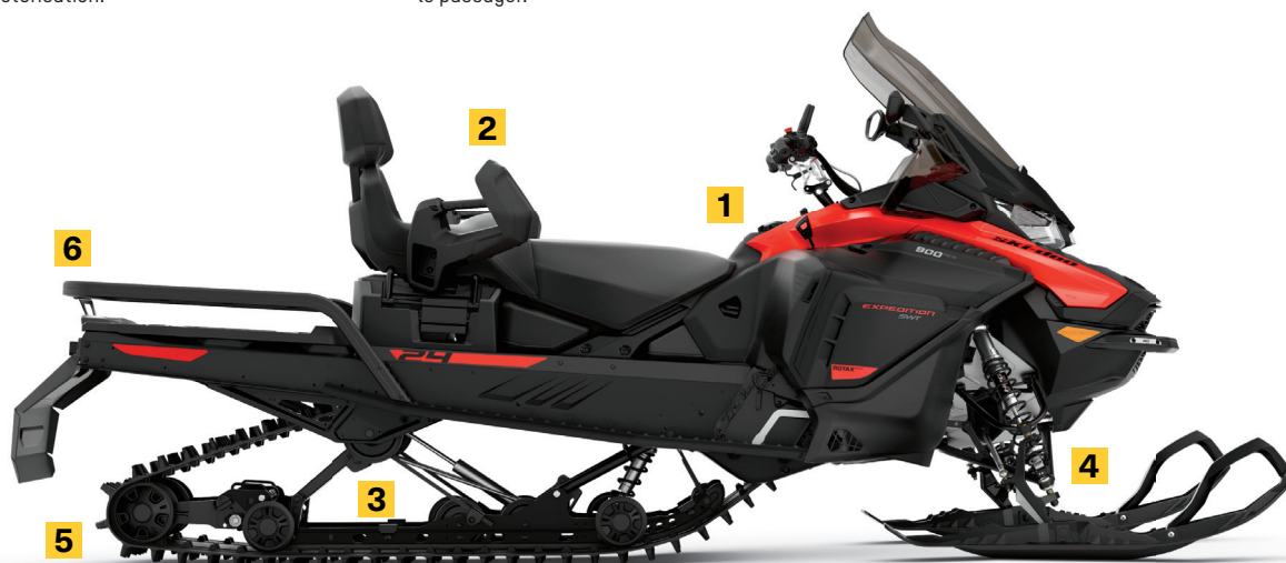
EXPEDITION® SWT 900 ACE MC TURBO MONTRE

Le rail articulé maximise la traction dans la neige profonde en marche arrière, et le mécanisme de verrouillage sans outil est idéal pour le remorquage.