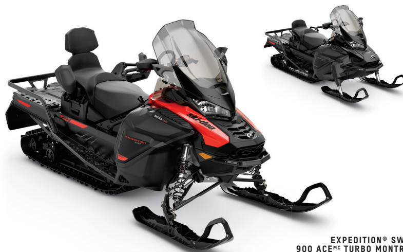
EXPEDITION® SWT 900 ACE MC TURBO MONTRÉ

Suprême motoneige sport-utilitaire pour la neige profonde, avec une flottaison insurpassable et l'ensemble idéal de caractéristiques utilitaires.