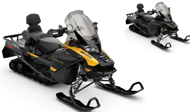
EXPEDITION® LE 900 ACE MC TURBO MONTRE

Une motoneige sport-utilitaire de randonnée, dotée de caractéristiques polyvalentes, parfaite pour les expéditions hors-piste et les randonnées en sentier.