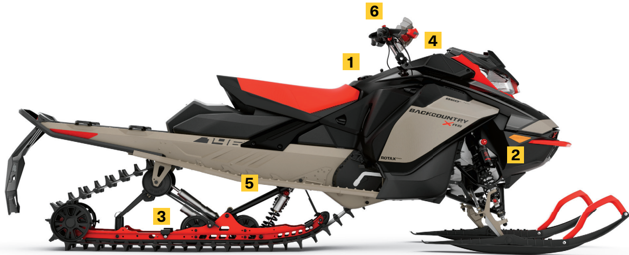
BACKCOUNTRY MC X-RS ® 146 850 E-TEC ® MONTRÉ

Suspension pour motoneiges hybrides utilisant les meilleurs principes de la rMotion MC de sentiers et de la tMotion MC de montagne pour prendre les virages avec assurance et effectuer des manœuvres avec agilité en neige profonde.