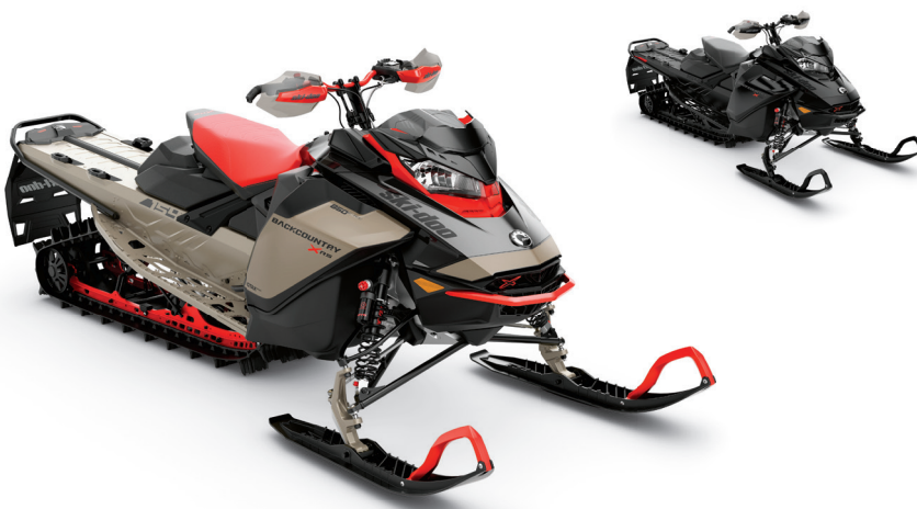
BACKCOUNTRY MC X-RS ® 154 850 E-TEC ® MONTRÉ

Le modèle hybride le plus agressif avec une attitude de snocross et la capacité d'aller partout.